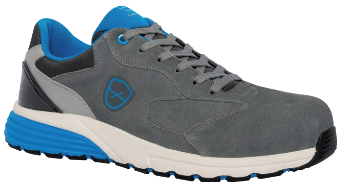
■ 6815 Gris