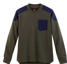
■ 1478 HEATHER KHAKI