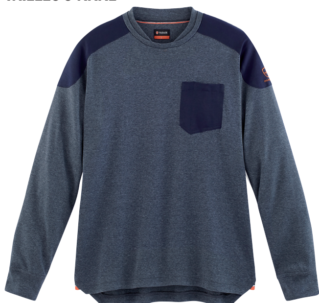
■ 1492 HEATHER PARADE BLUE