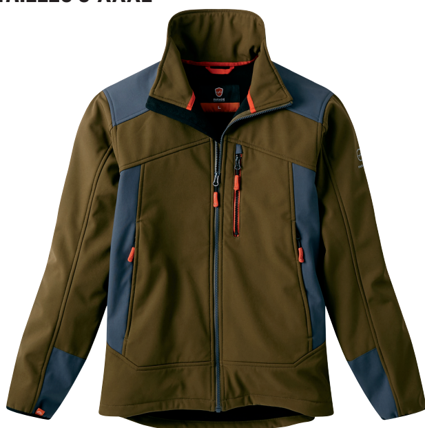
■ 1478 KAKI