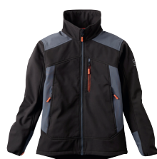
■ 1495 DARK BLACK