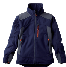
■ 1482 NAVY