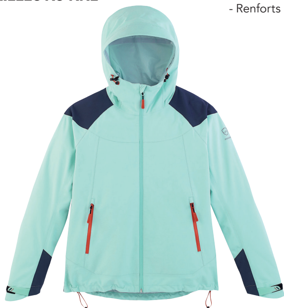
■ 1718 ICE GREEN