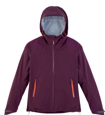
■ 1783 PURPLE