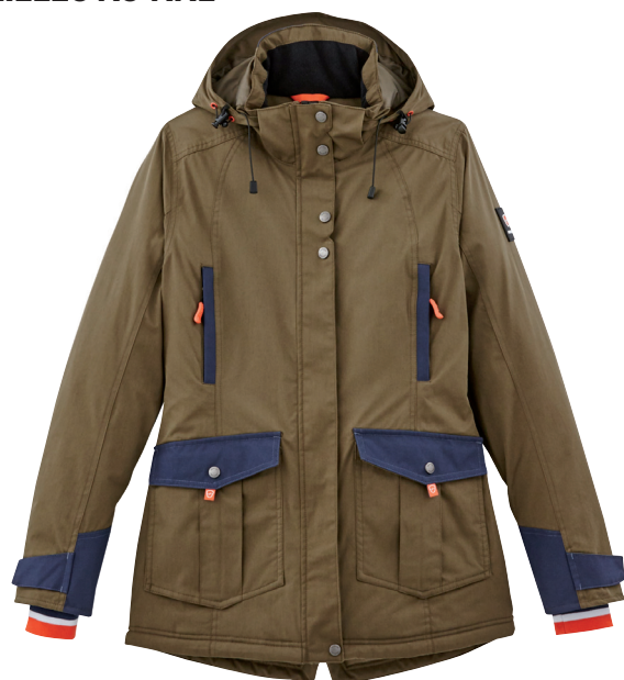
■ 1788 ARMY