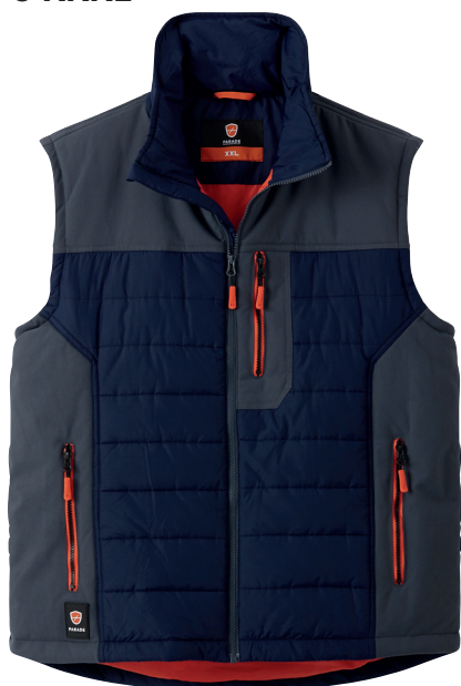
■ 1482 NAVY