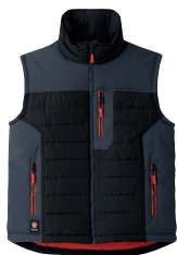
■ 1494 DARK BLACK