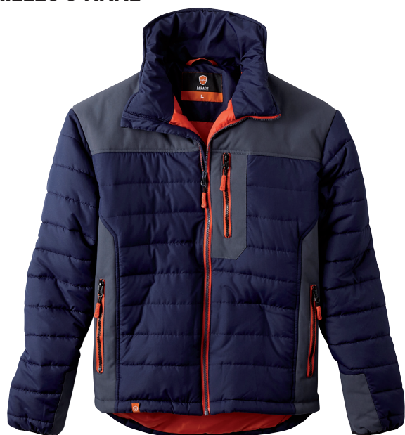
■ 1482 NAVY