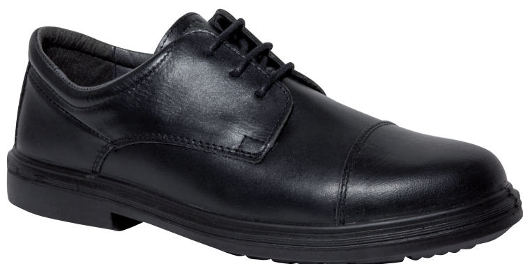
■ 5814 Noir