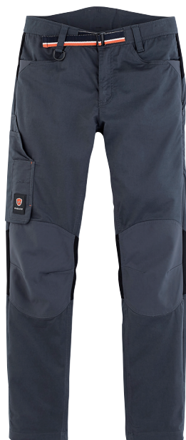
■ 1753 PARADE GREY