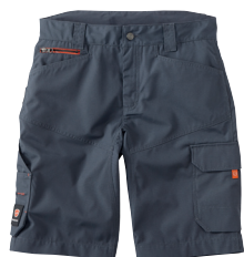
■ 1453 PARADE GREY