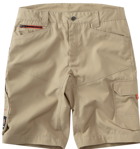
■ 1470 SAND