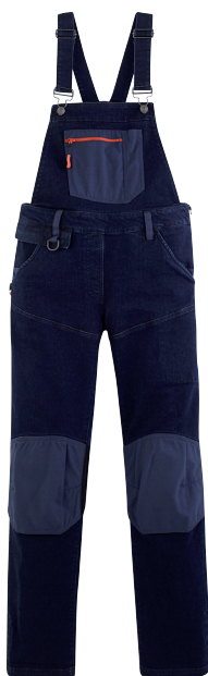
■ 1772 DENIM

La salopette en denim à empiècements lycra pour plus d'aisance et de confort :