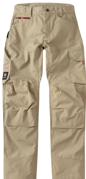
■ 1470 SAND